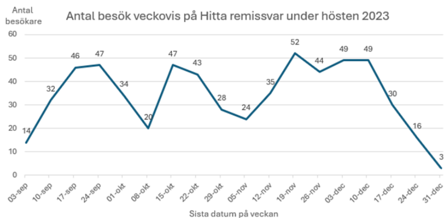
Figur 2. Graf över antal besök på Hitta remissvar på veckobasis