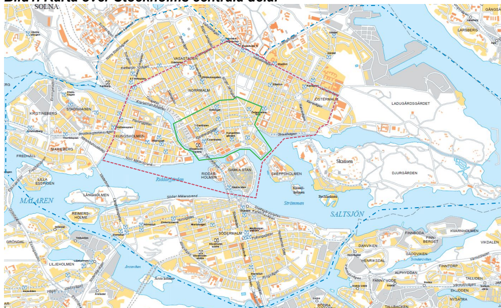
Bild1. Karta över Stockholms centrala delar

Kartläggningen av de statliga myndigheternas lokalisering omfattar hela Stockholm, Solna och Sundbyberg. Uppdelningen av centrala Stockholm är densamma som i föregående analys.