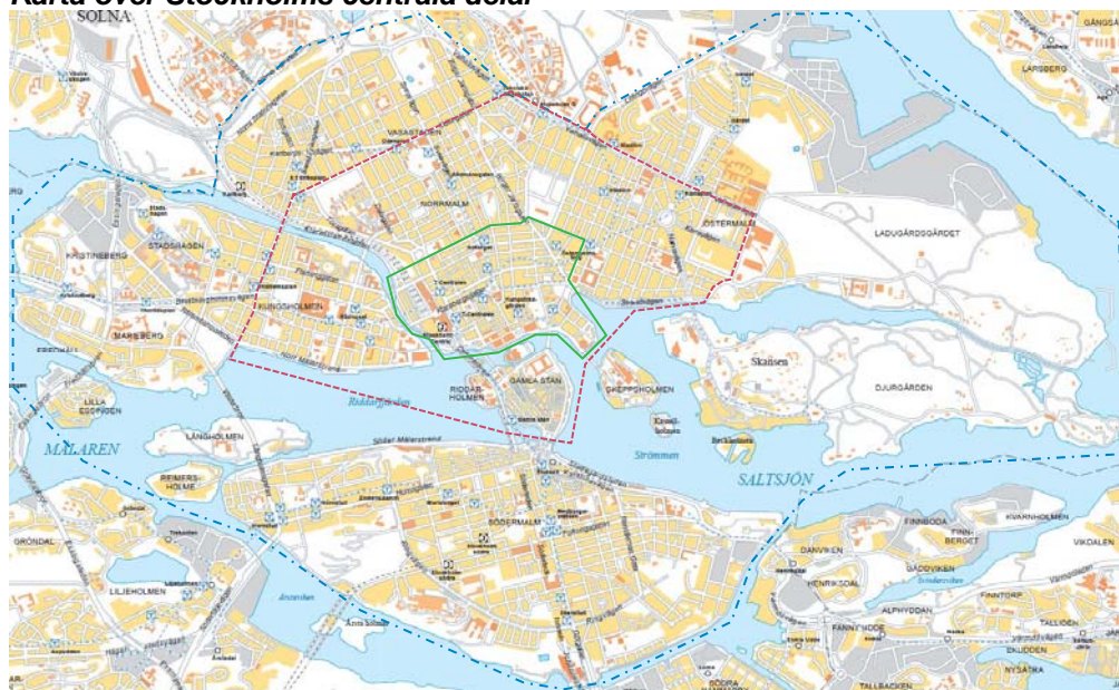
Karta över Stockholms centrala delar

Kartläggningen av de statliga myndigheternas lokalisering omfattar hela Stockholm, Solna och Sundbyberg. Uppdelningen av centrala Stockholm är densamma som i föregående analys.