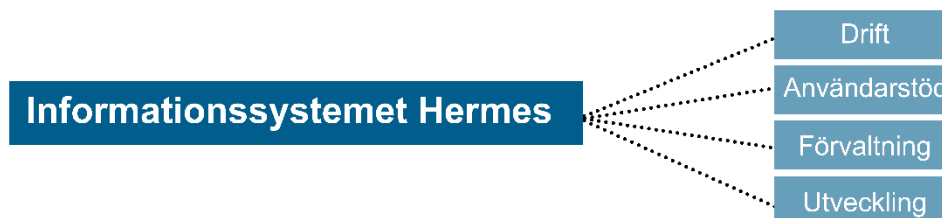
Tabell 6. Kostnader inom verksamhetsområdet Informationssystemet Hermes (tkr)