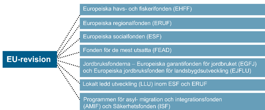
Figur 3. Verksamhetsområdets indelning

Vi har delat in verksamhetsområdet EU-revision utifrån de fonder där vi genomför revision. Fonderna bedriver sin verksamhet inom EU:s sjuåriga budgetperiod som sträcker sig från 2014 till 2020. Jordbruksfonderna är ett samlingsbegrepp för EGFJ och Europeiska jordbruksfonden för landsbygdsutveckling (EJFLU).