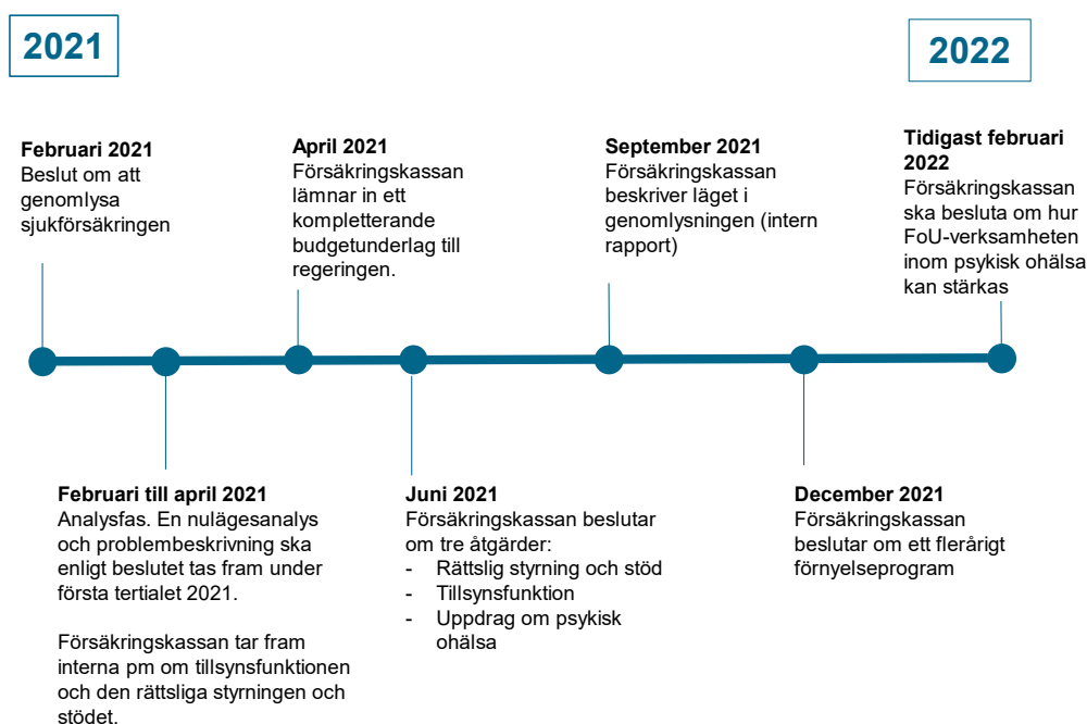
Figur 3. Tidslinje över Försäkringskassans beslut och åtgärder 2021–2022.

Försäkringskassan inledde i början av 2021 ett arbete med att genomlysa all verksamhet som berör förvaltningen av sjukförsäkringen. Generaldirektören pekade ut tre förbättringsområden eller åtgärder: rättslig styrning och stöd, tillsynsfunktion och psykisk ohälsa. Genomlysningen var till stora delar färdig hösten 2021. Förändringsarbetet samordnas sedan december 2021 i ett förnyelseprogram.