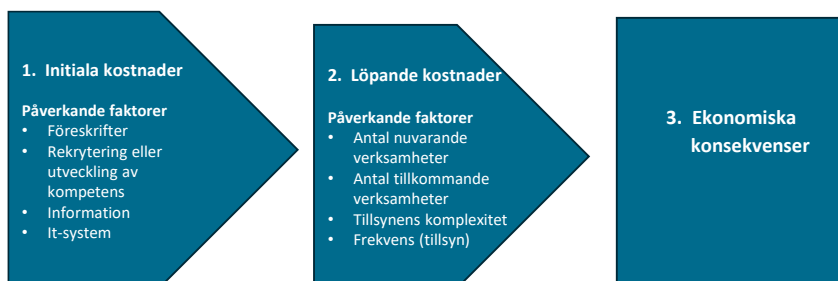
Figur B1. Modell för analys av ekonomiska konsekvenser för tillsynsmyndigheterna.

Samtliga föreslagna tillsynsmyndigheter bedriver någon form av tillsyn i dag. Men vi konstaterar också att flera av dem skulle få en eller flera nya sektorer att tillsyna när utredningens förslag genomförs. Det gör att de kostnader som myndigheterna uppskattar för en verksamhet som ännu inte har kommit i gång är något osäkra. Flera faktorer är inte klarlagda, som antalet verksamheter som omfattas av tillsynen. Analysen av de ekonomiska konsekvenserna för varje myndighet är därför med nödvändighet endast den bästa möjliga bedömningen från Statskontorets sida och inte en exakt kostnadsberäkning.